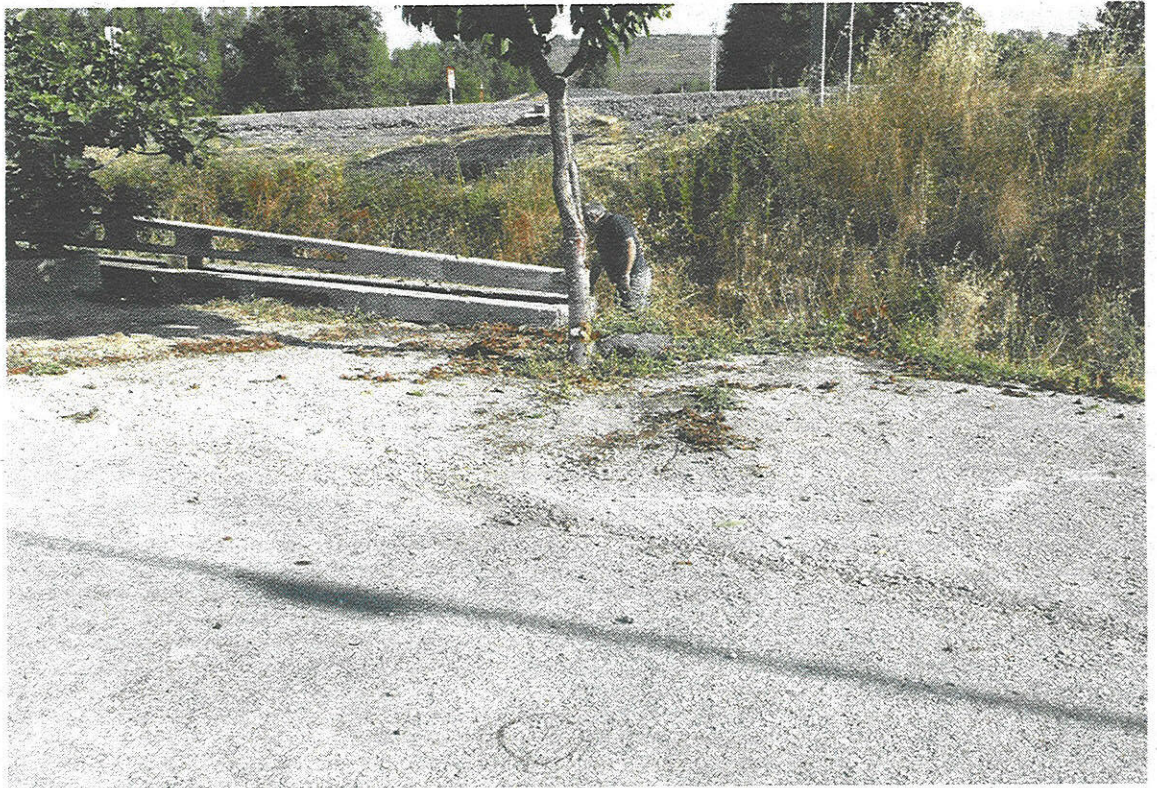
Una imagen del lugar donde mataron al taxista ponferradino en la localidad de Las Ventas de Albares. GAZTELU

La jueza, en su auto, también considera que, aunque Florencio Domínguez apenas quiso realizar declaraciones, existen indicios de su presunta implicación tanto en