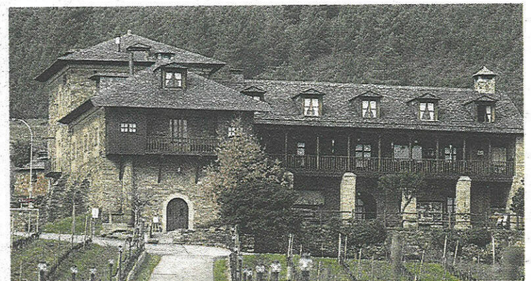
Los premios Palacio de Canedo promocionan el medio rural. GAZTELU

En esta fase del concurso los miembros del jurado visitarán los edificios presentados para proceder a su valoración in situ. ✱