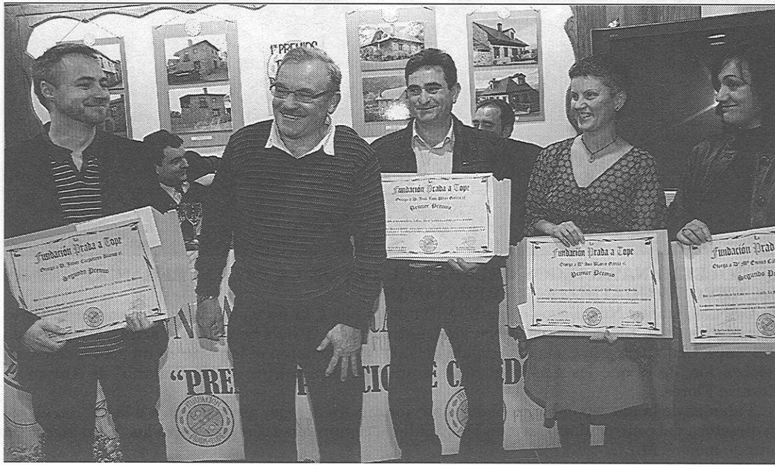
Los premiados posan con Prada tras recibir el reconocimiento

Añadió que Prada "es una persona a la que tenemos todos que admirar y nos gusta-