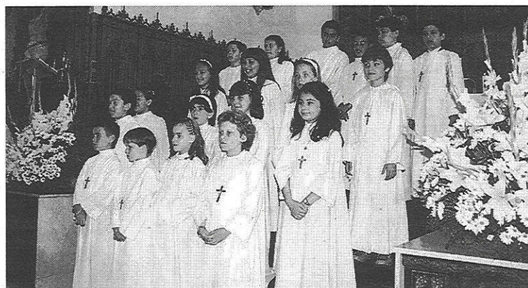
Ceremonia de la Primera Comunión en la nueva parroquia.

La parroquia del Buen Pastor celebró este fin de semana por primera vez ceremonias de primeras comuniones para un total de 18 niños. Debido a que la iglesia de La Rosaleda todavía no está disponible, los niños celebraron este acto religioso en la iglesia de San Ignacio. ✽