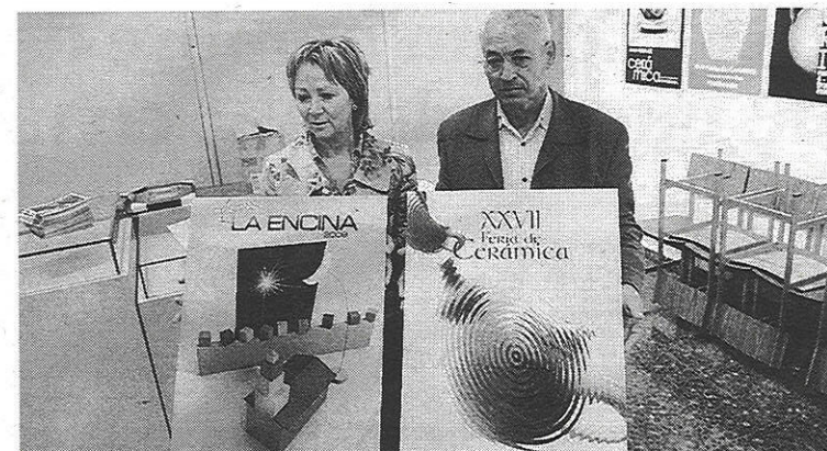
Imagen de los carteles ganadores en ambas categorías.